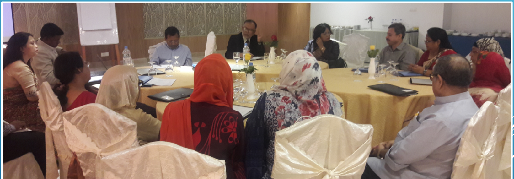
Groupe Consultatif de Plaidoyer Advance Family Planning

Introduction du crochet et du forceps pour la ligature des trompes afin d'améliorer la qualité des soins